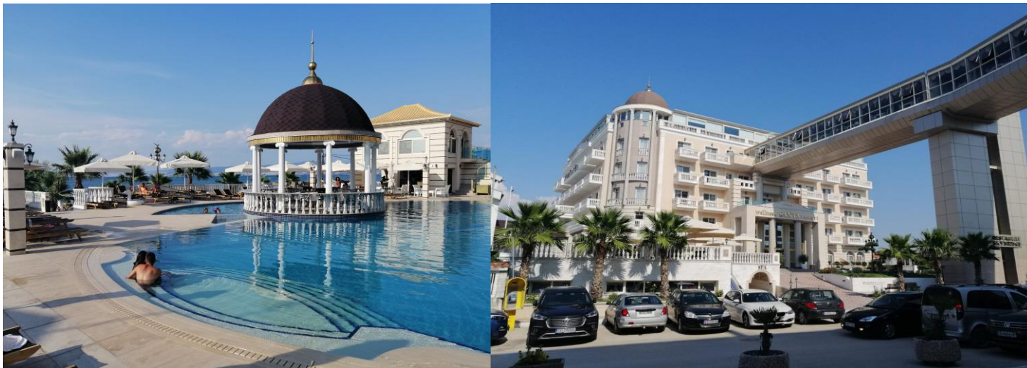
SANTA BEACH HOTEL KOMPLEX